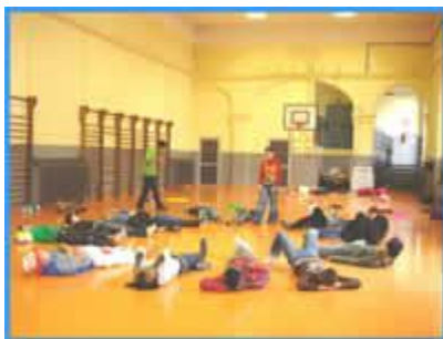
Circostanza all'CTP Parini di Torino